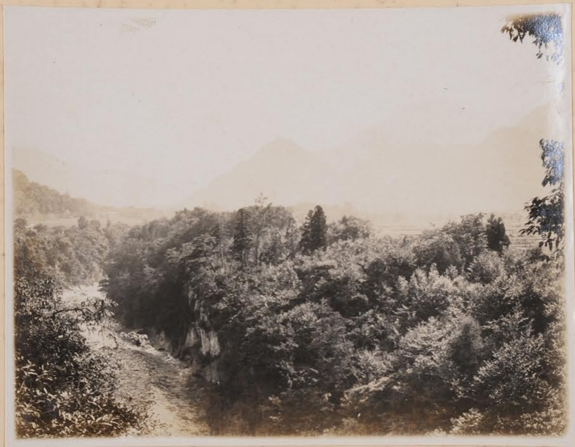
手取川、石段と下峡流 瀧木路附近