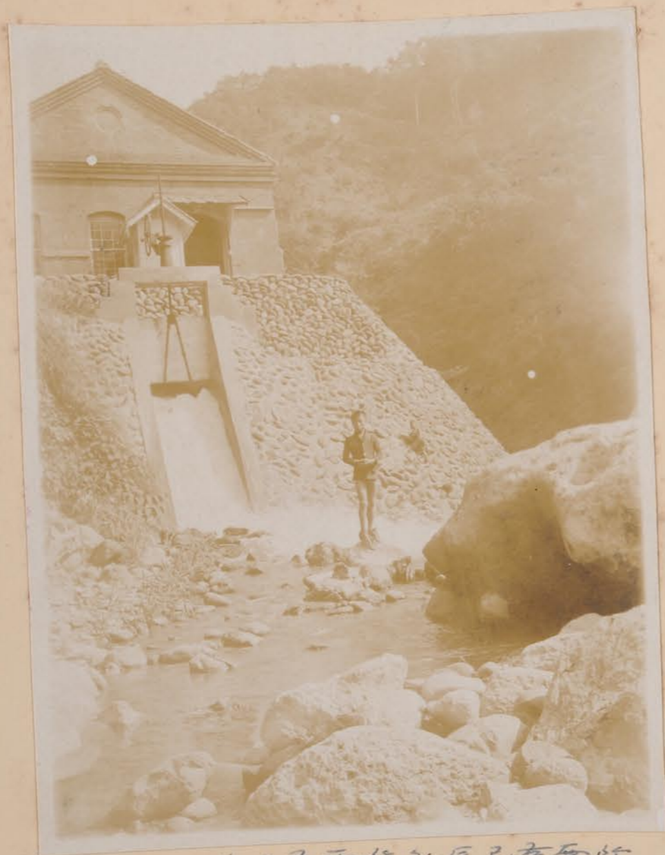
本館署初，水力發電所外屋已考定行