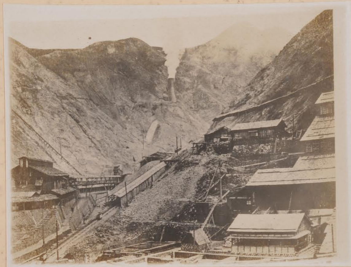
能登町 山崎町 十屋 町 町 町 此 町 町 町 町 町