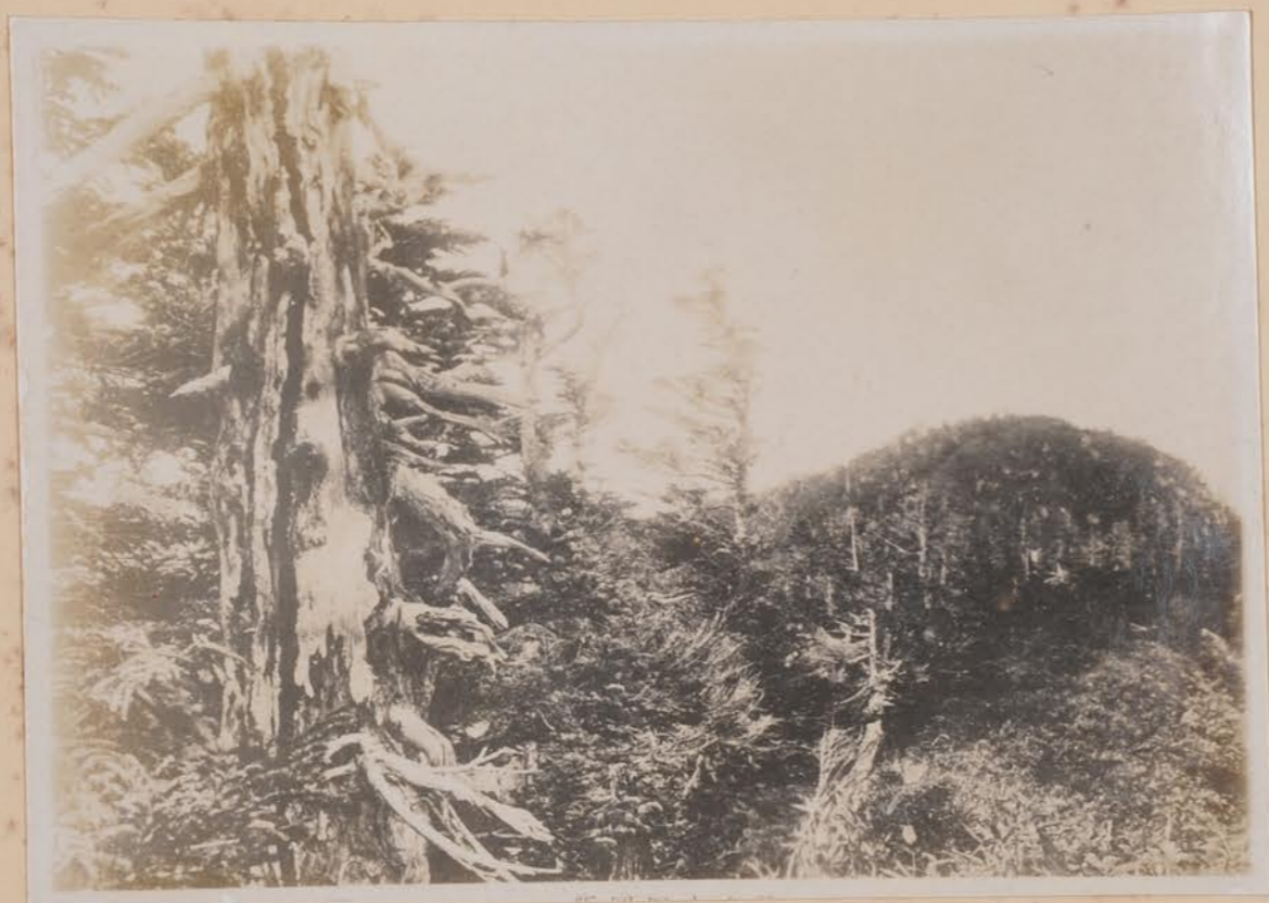
白山、針葉樹(右塔道縦々回、赤江ノ山々) 守田氏・撮ル