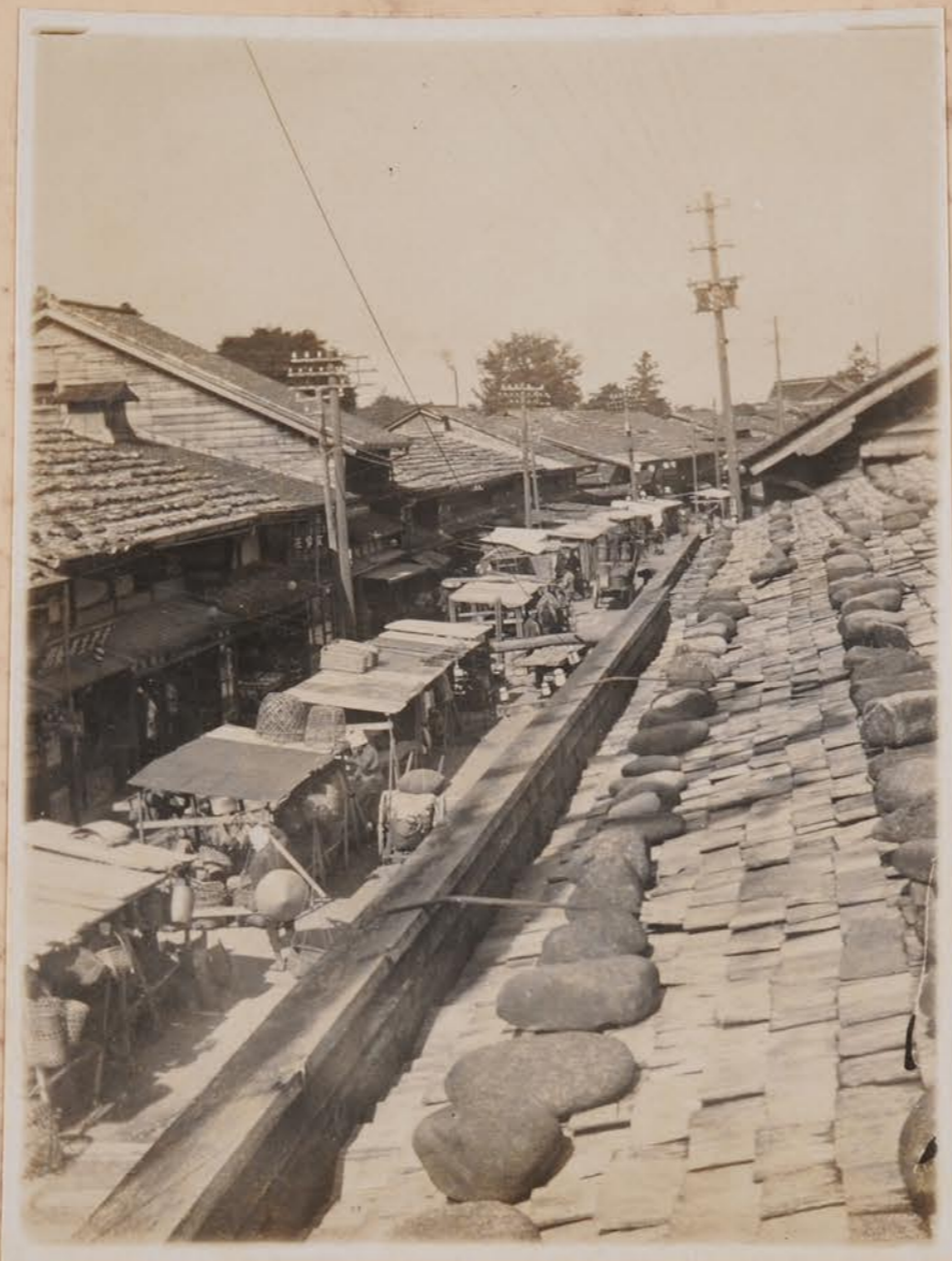
鶴来 定期市 一古市場