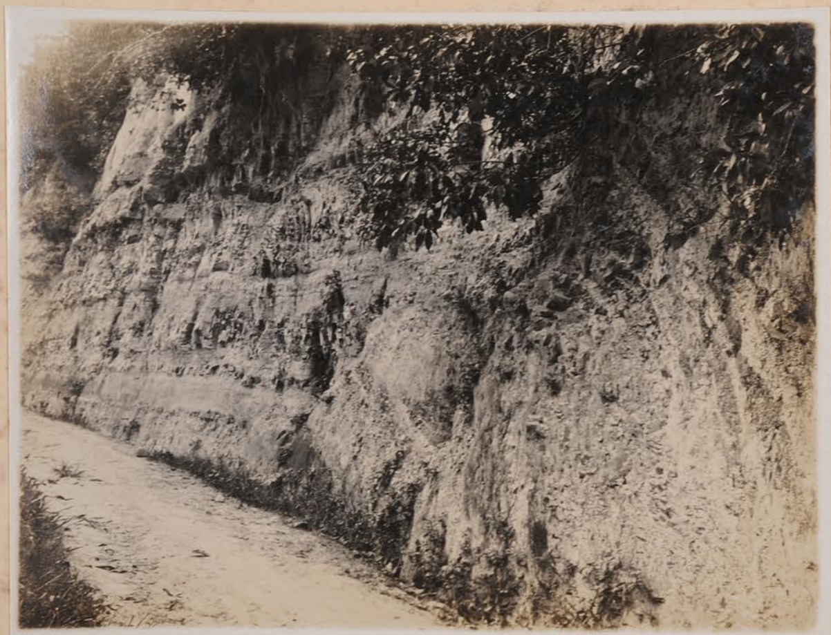
屏川岩木村附近，土層，橫曲