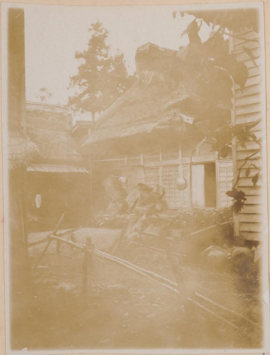
加賀地方、農家 入母屋造り、軒真 が多い。