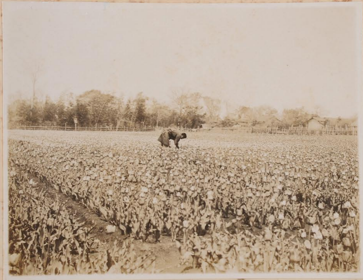
全波市南部 1 42-1170 女田