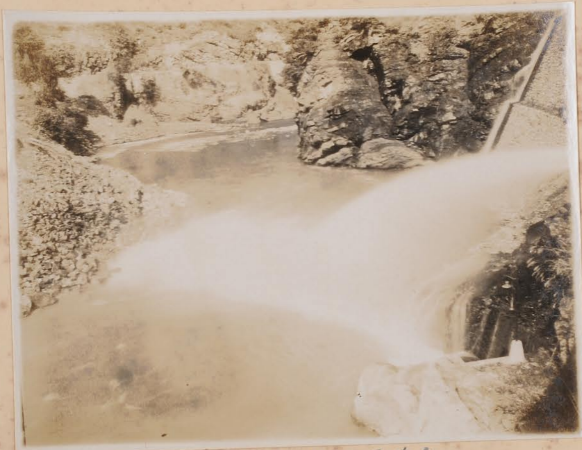
白山水力發電所放水路附近，負素亭