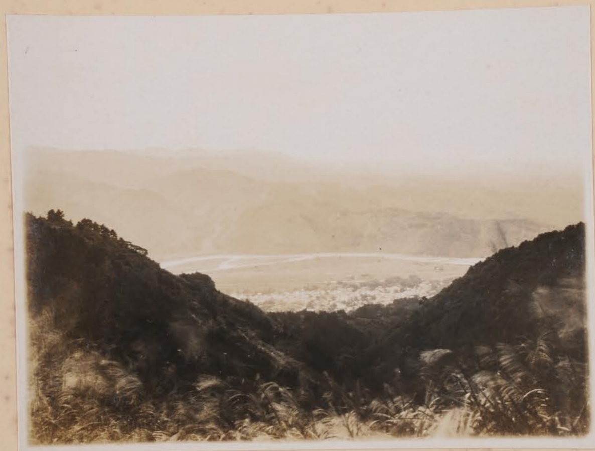
1912年7月 山崎山 下 山崎山 山崎山 山崎山 山崎山