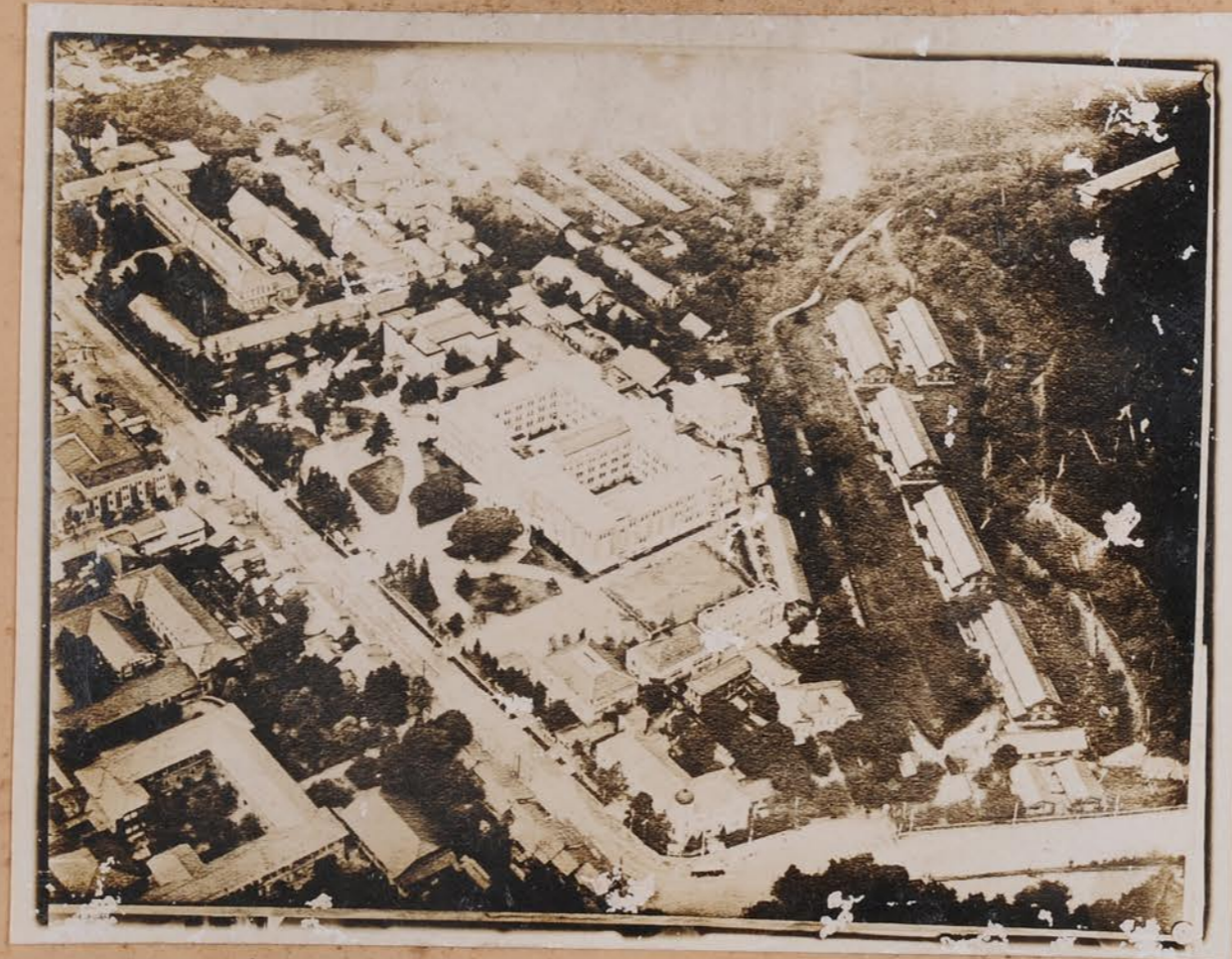
金陵市 新市部 航空字景