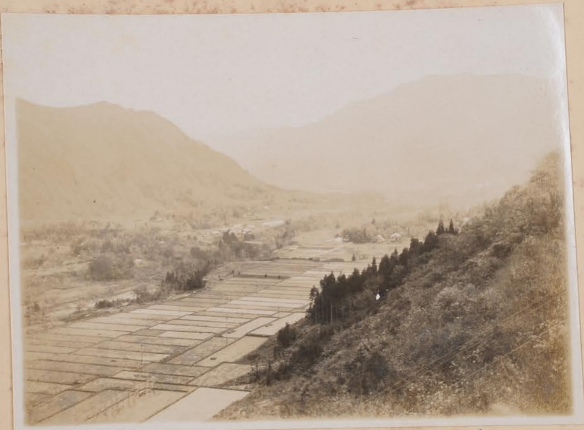
白山川、小橋より、下瀬川手取川去野右、等籠 白子居根、白山下駅