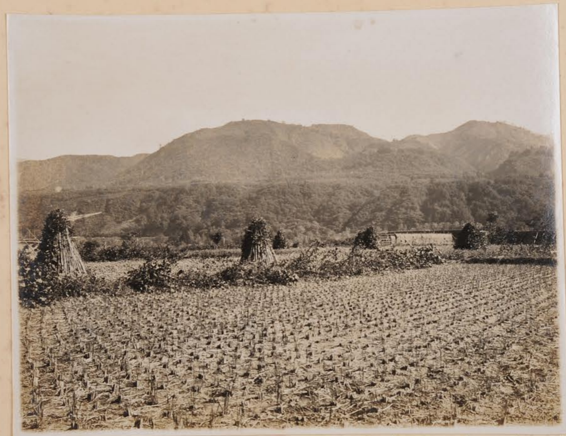
午取川福園附也、仍取之 止學、來、華、煙、新、校、接、改、教、基