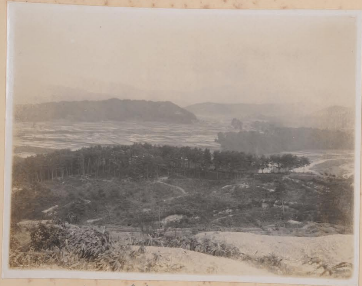
三小年山以遠望以小立野台也及館山丘陵