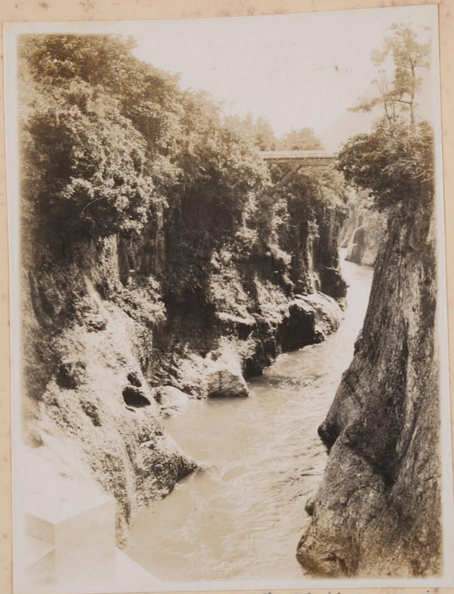
午取川谷橋水附近門橋下、峡谷