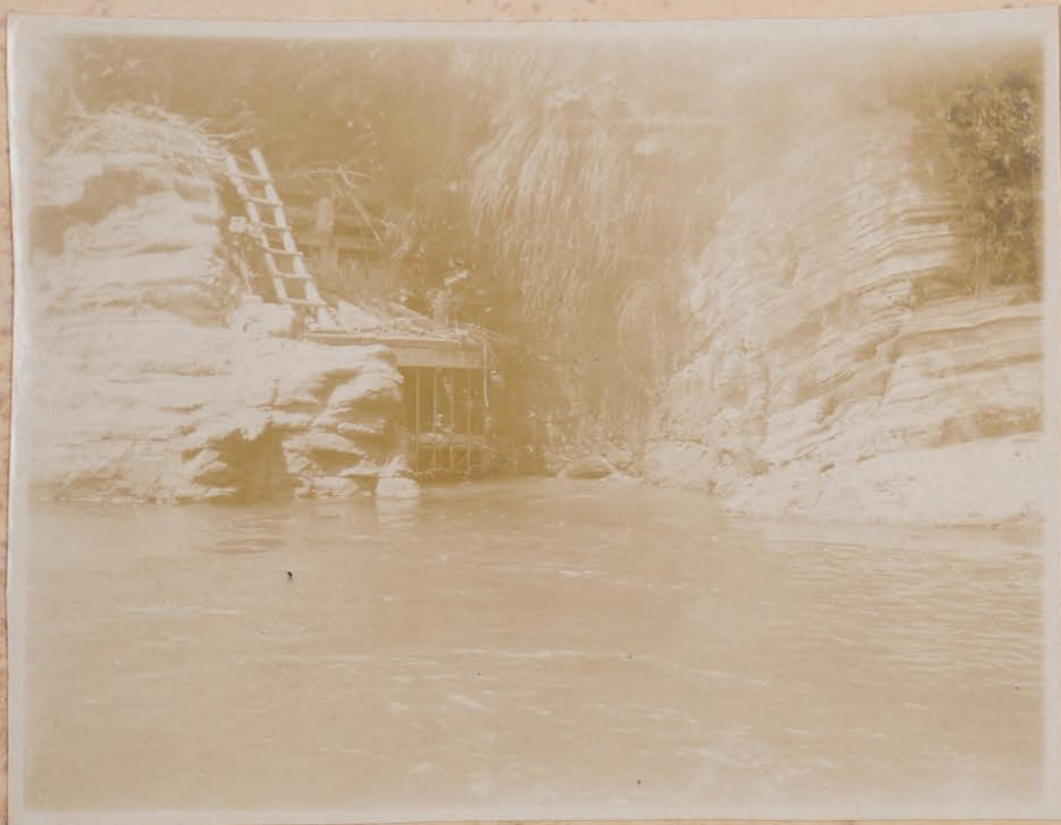
屏川上居已=如乳居已同水取入也