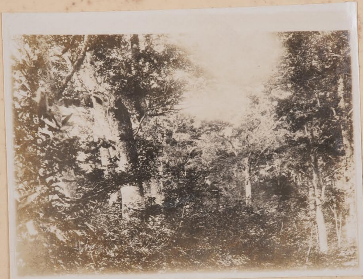
白山、洞華樹亭 一、秋、道、梅、の、病、ノ、ガ、ナ、林