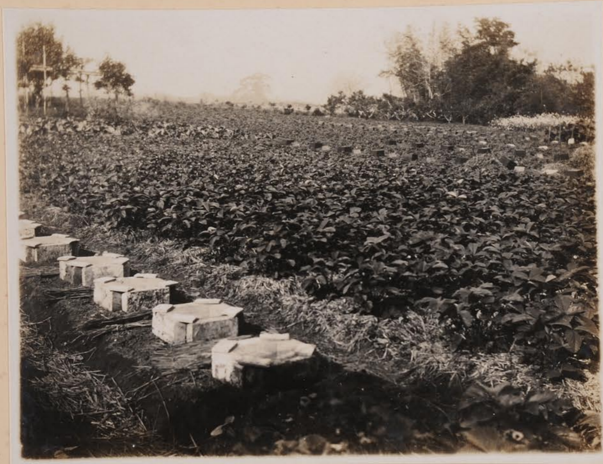
全以古部 / 筒易 2 —4 1 每栽培