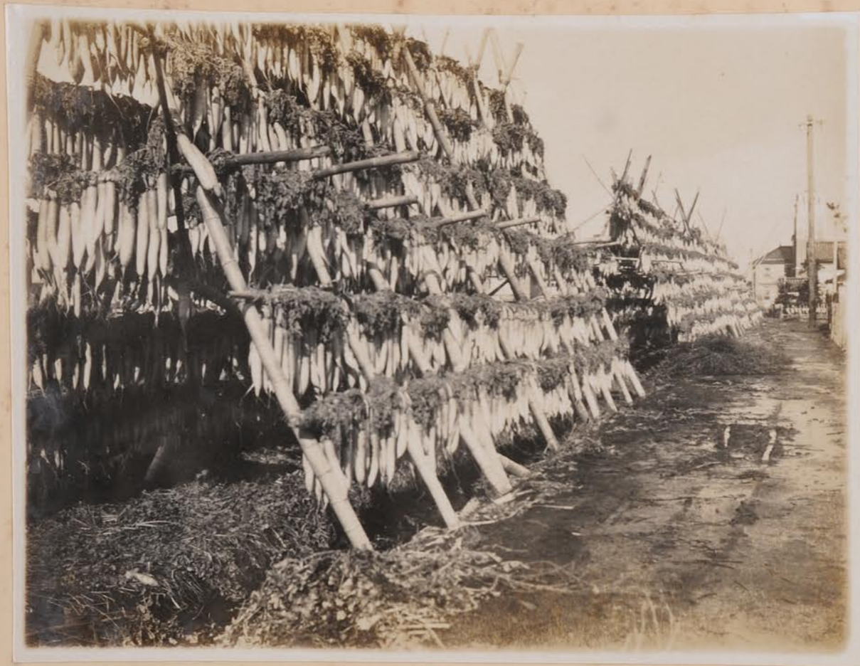
全汉市南郊，以庵大松，乾焯