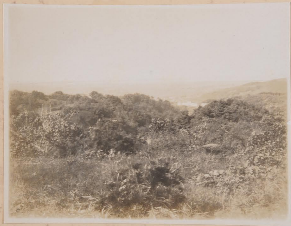
向山(向山) 生駒町内生写、梅峯砂丘の望 白+建初刀=牛子校