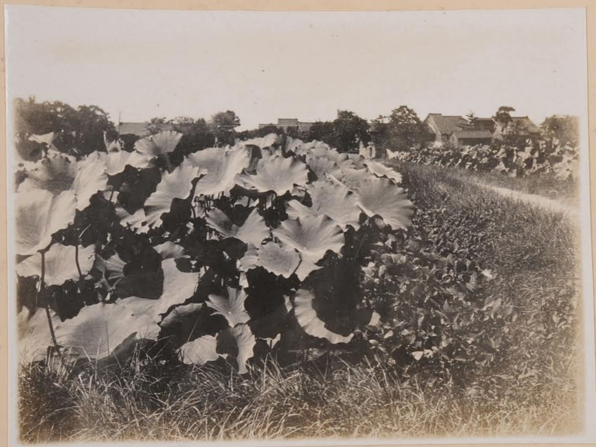
合怀市北郊，蓮，表境（伯遜型卷生上帶）