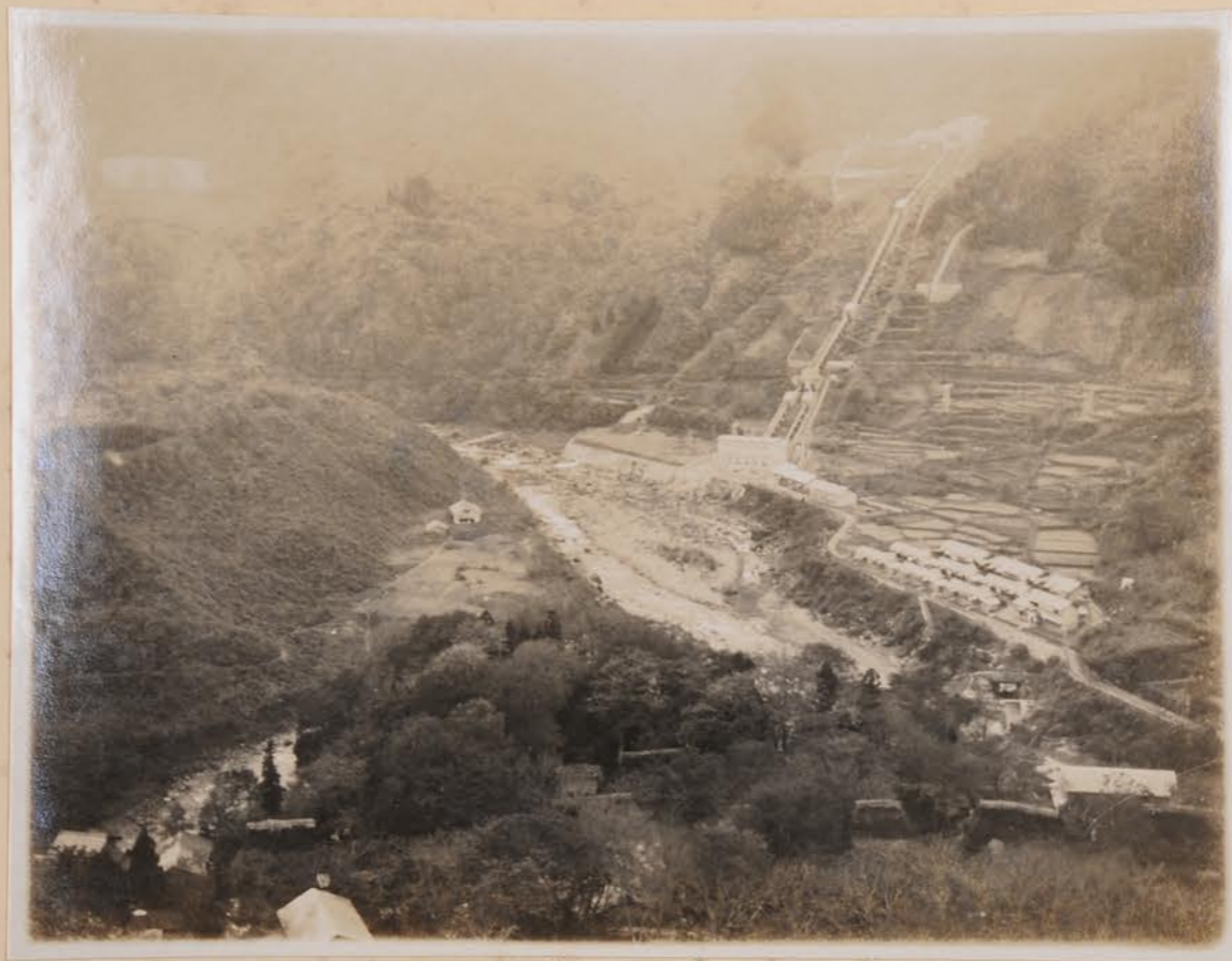
白山水カ、水播以鳥群考宛所、午飯川、木滑考2229