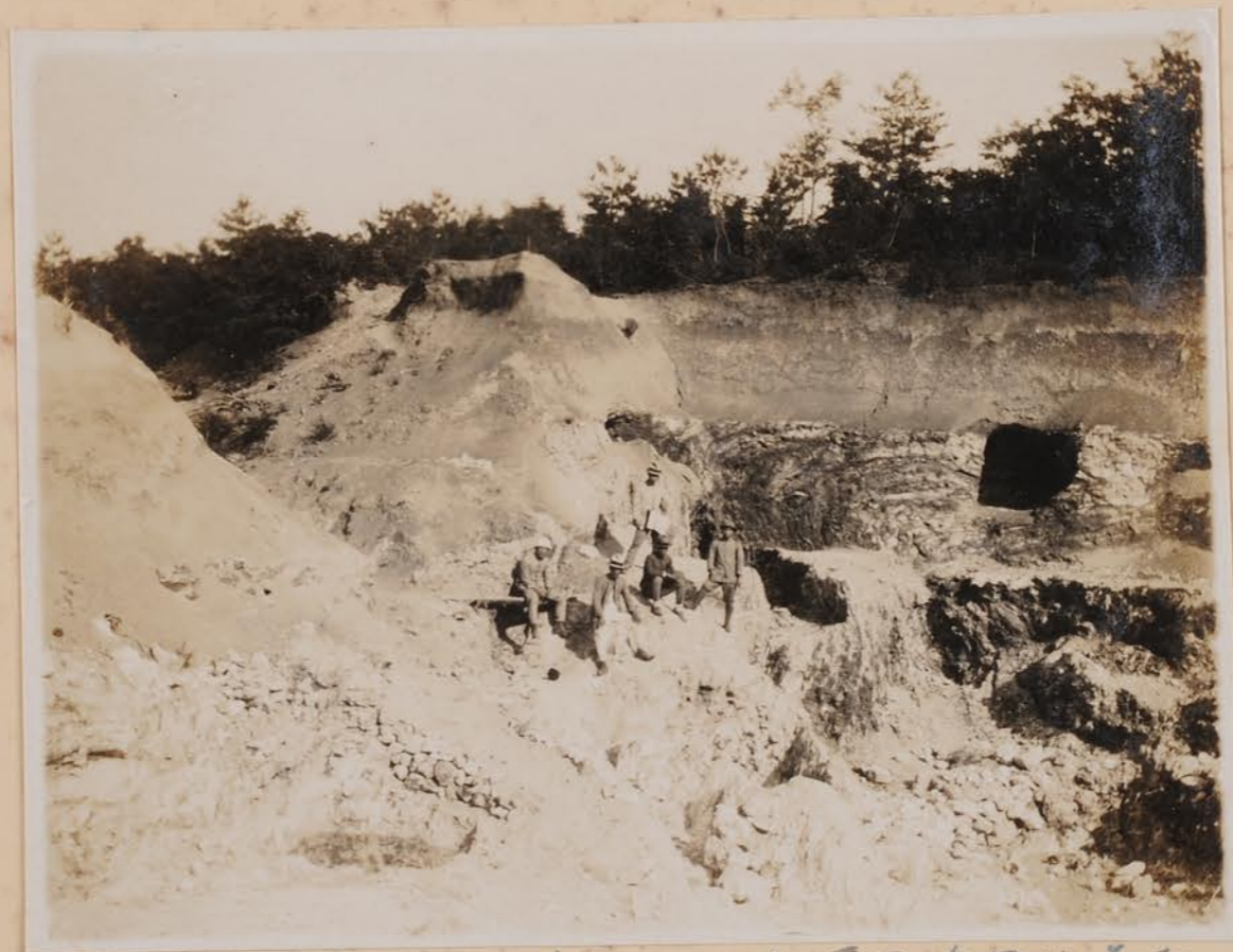
九右燒 原石 瓦板 此處所食田村在垣