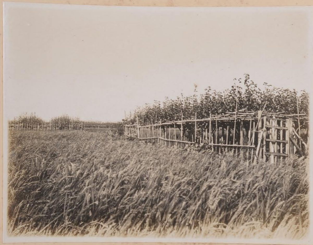
倉垣市西野戸松村、野畑