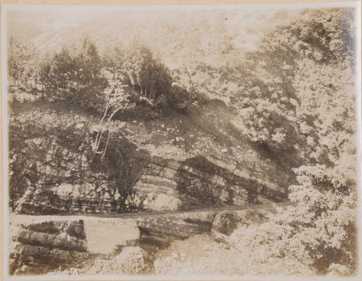
木塔寺附近，午頂統1頁光學 古面1白-石等