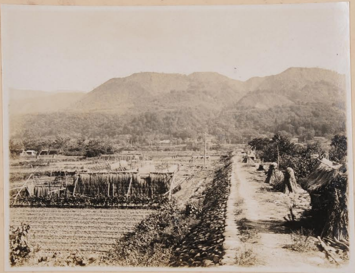
午野川 福岡附也、仍寄殿丘