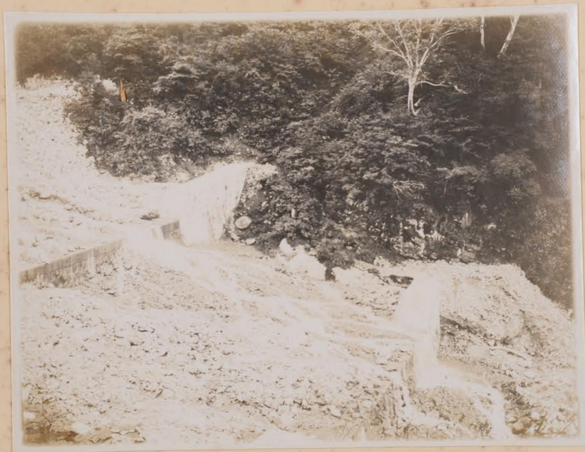
白山之牛柳在(石防工事)