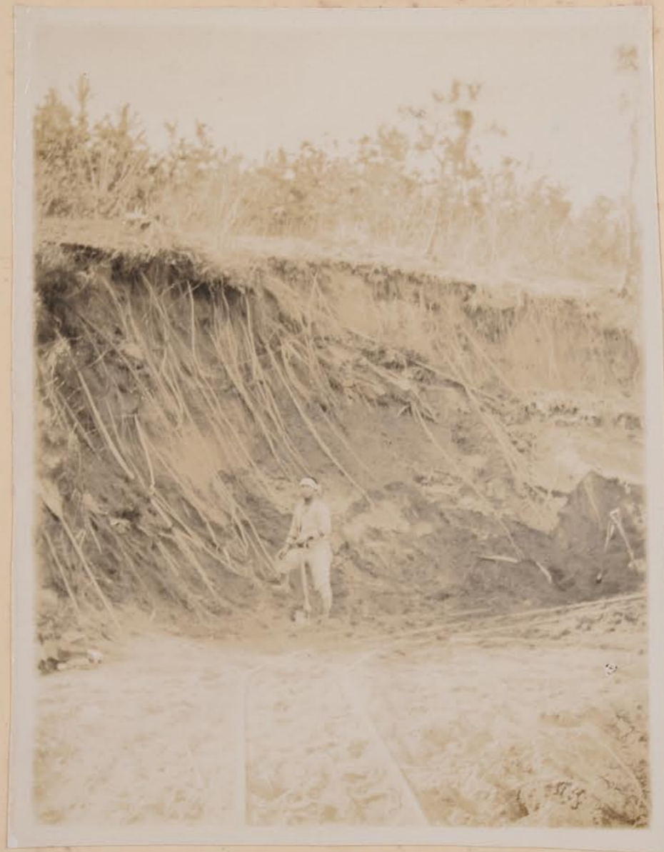
砂丘、中、於、之、合、欅、木、長、根