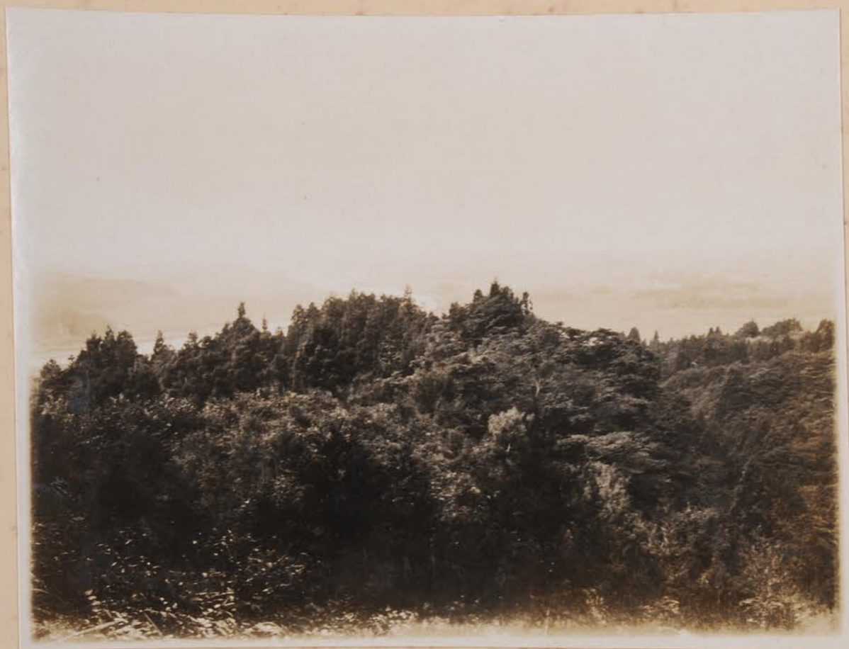
嶺南の也 風吹峠の遠望 石川平野、集村、千代川