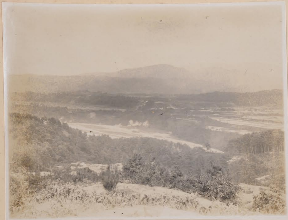
三斗山 三斗山 三斗山 三斗山 三斗山 三斗山 丘陵、小立野台地、舞川谷。