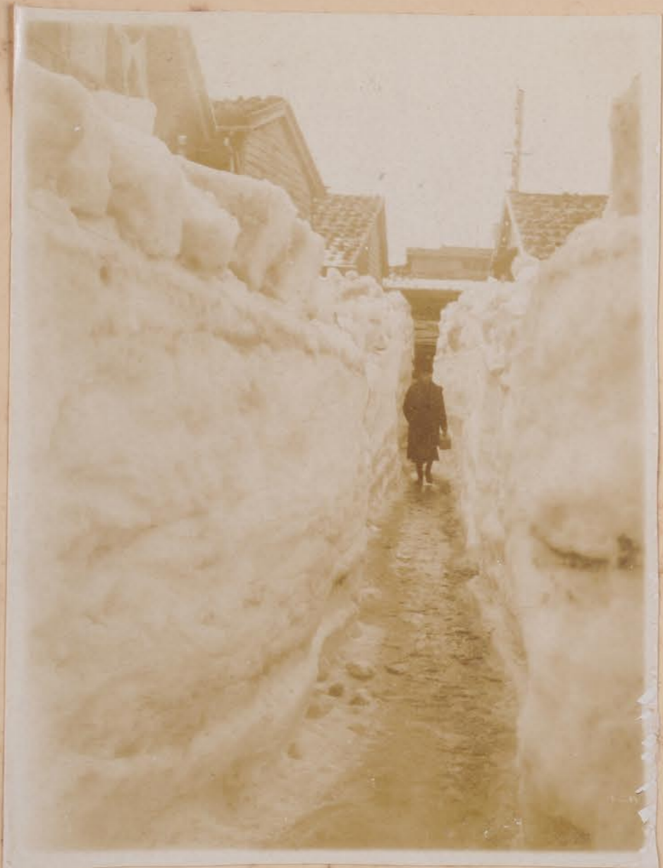
金沢市大雪 (昭和二年一月廿四日)