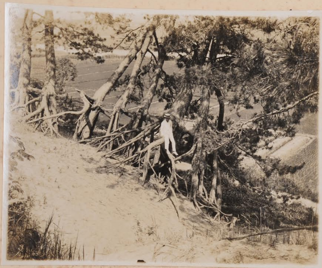
粟ヶ崎海邊、砂丘上根上り松