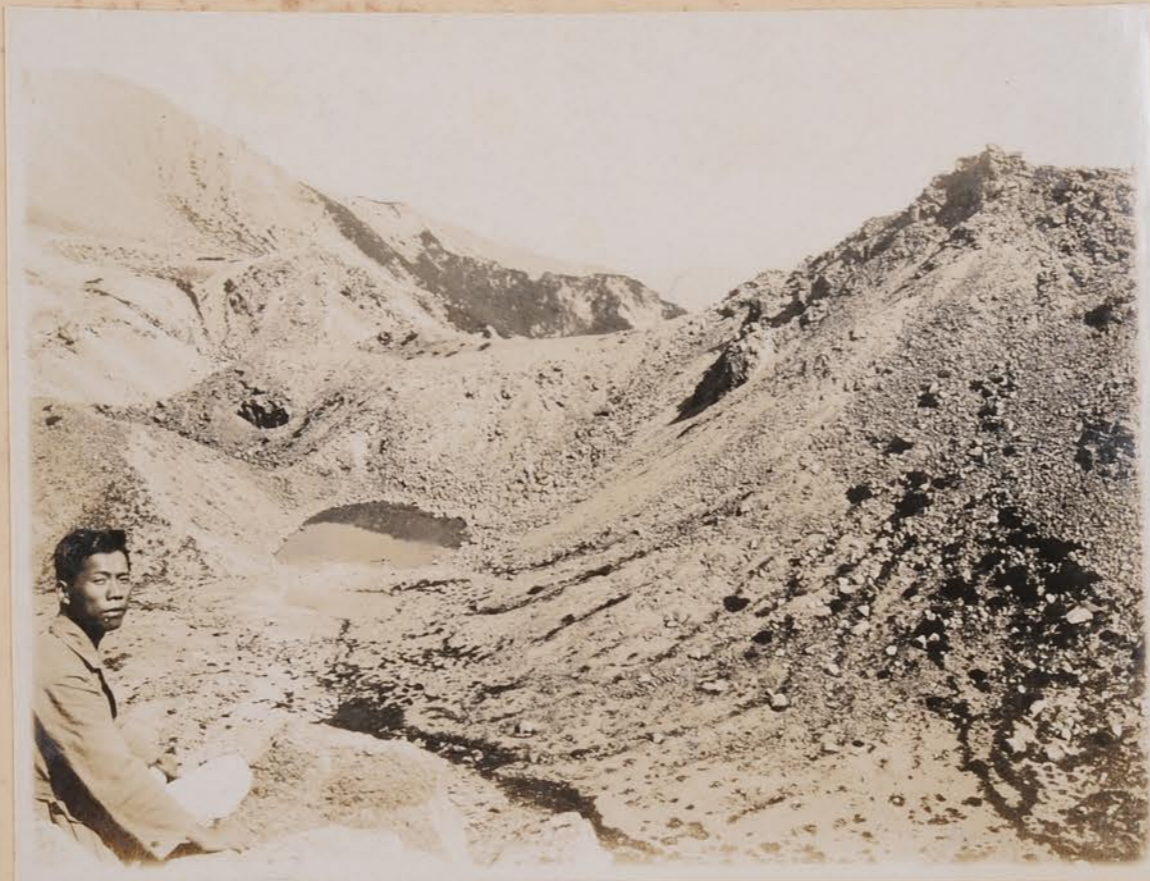
大女峯の甜倉池と銀峯