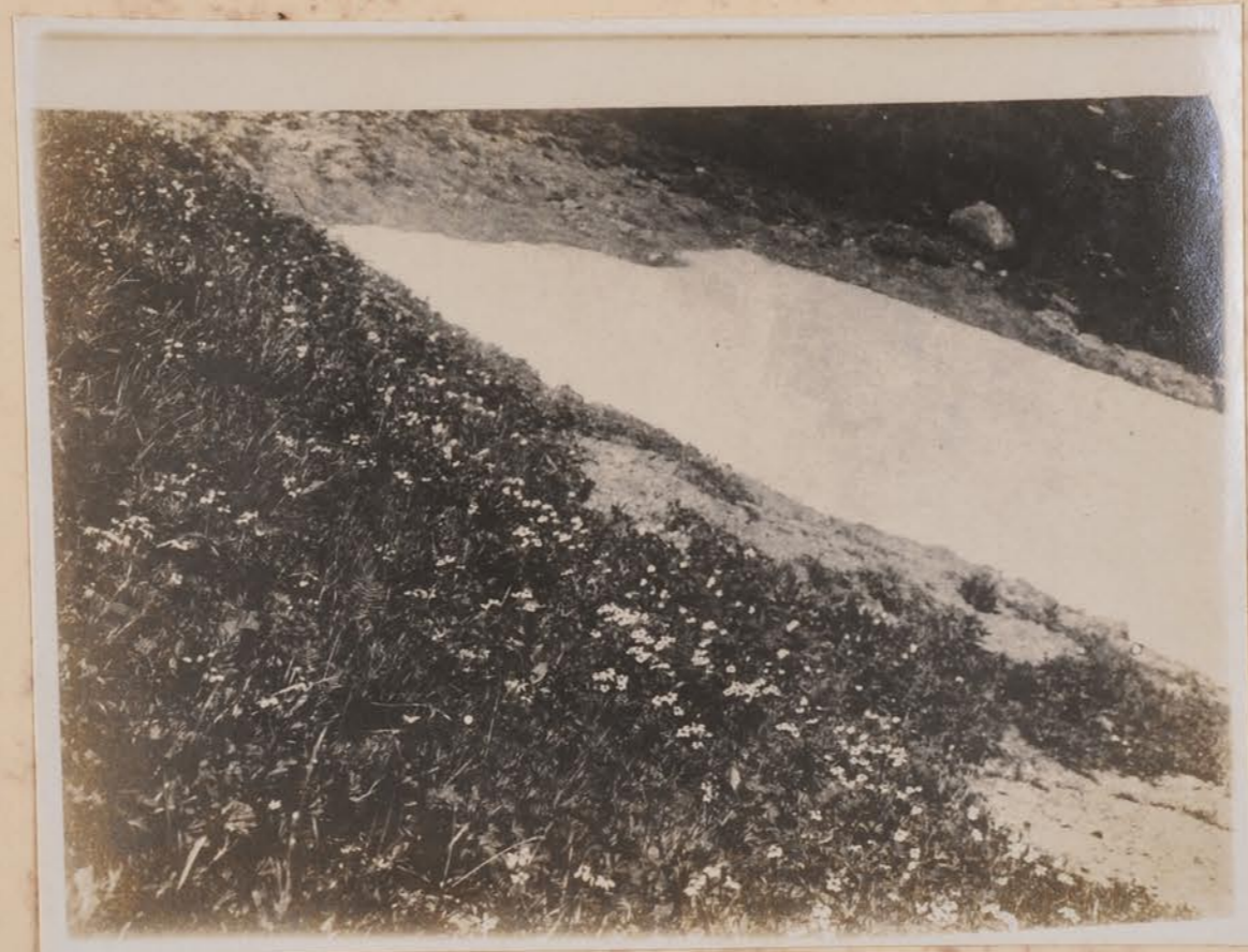
白山 弥陀寺附近、石花菜畑 平字安守内氏