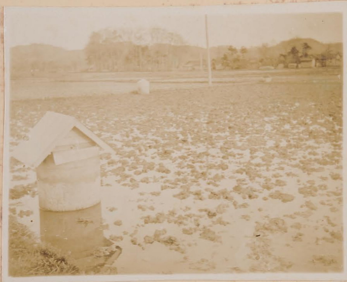
仍生仔怡安，低窪地帶，井上村，谷水邊，井戶