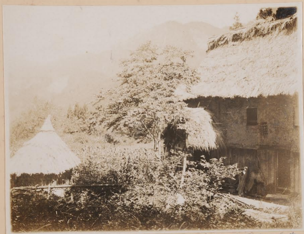
出作、民家 白雲村 小倉山及司車氏宅