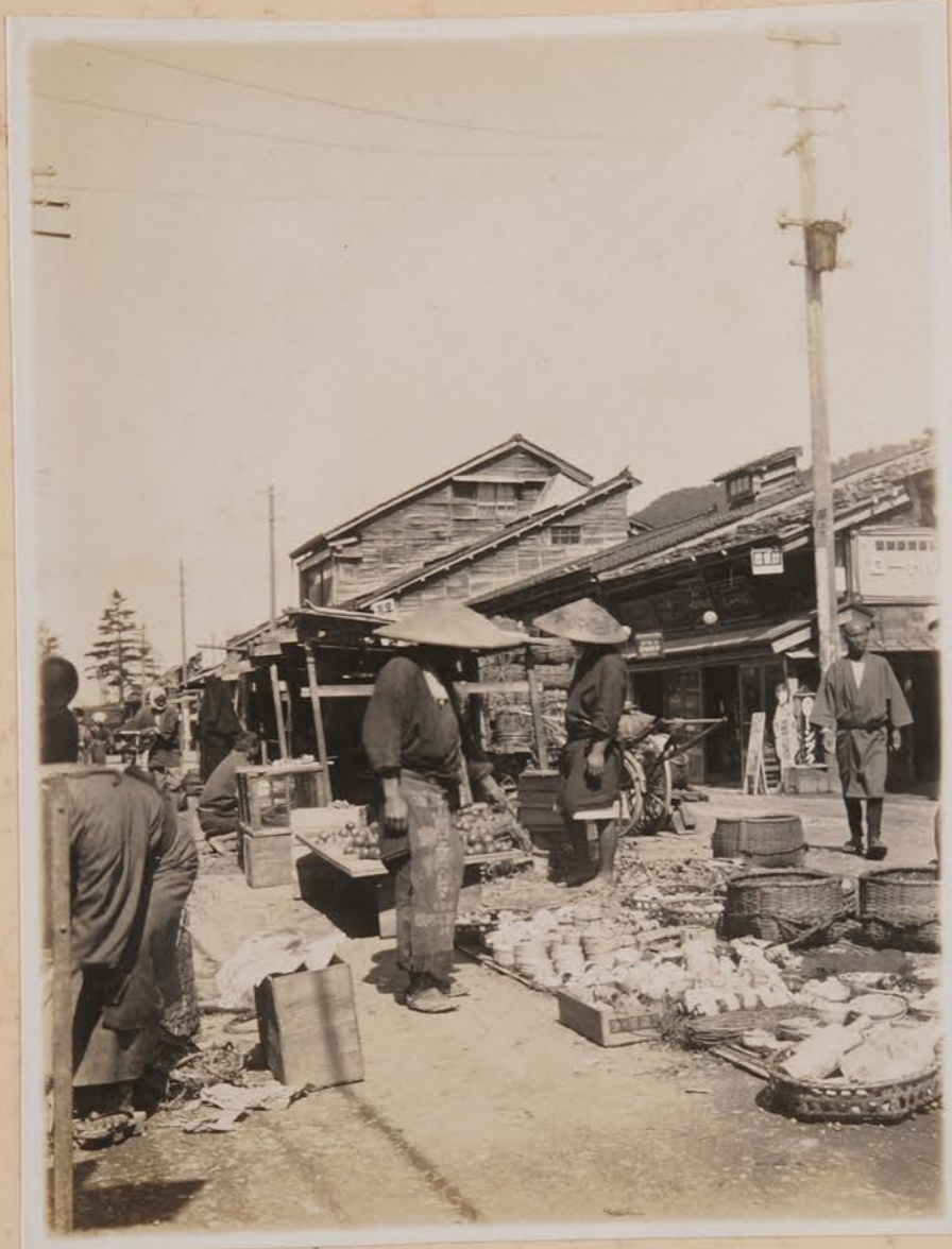
物取一云市場、カラム毛。