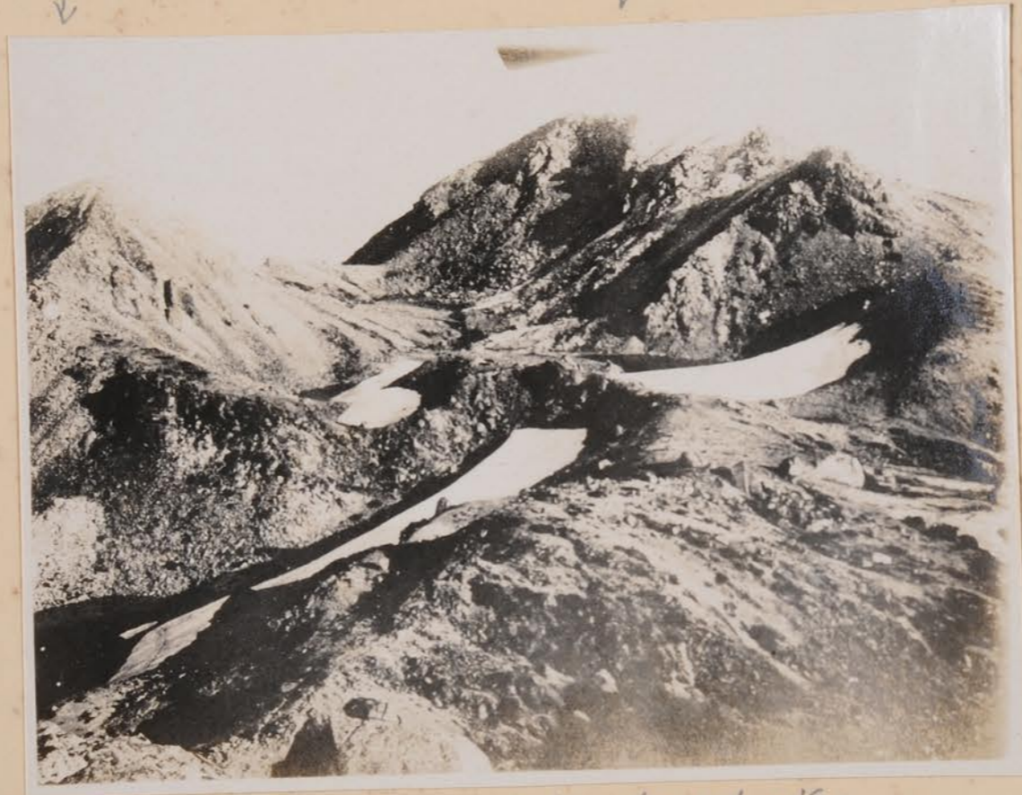
白山頂上 岳系 岳の 大世 銀 峰 3 峰 4 大世 岳系 (至 岳系 岳の 岳系)