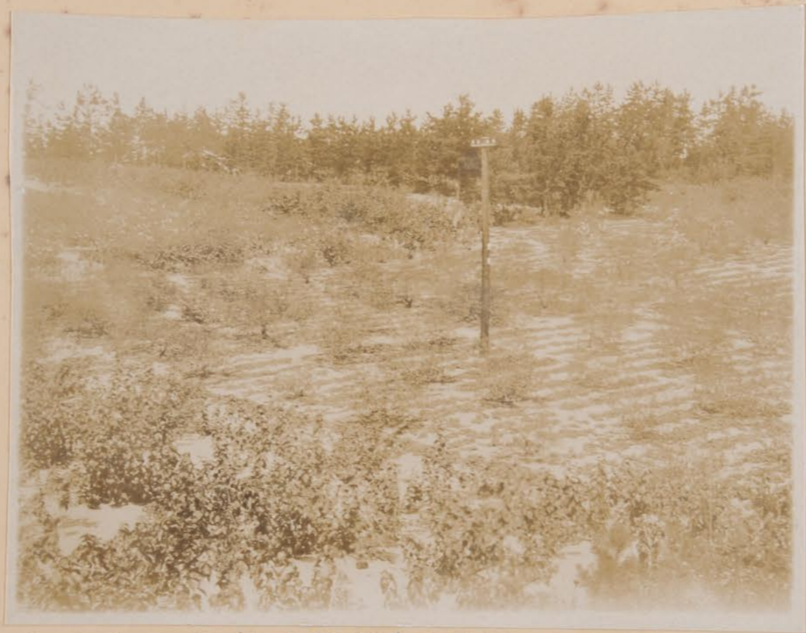
河北新七塔村木桿附近 / 桃畑 也里-聖畑 (海峽勸業社)