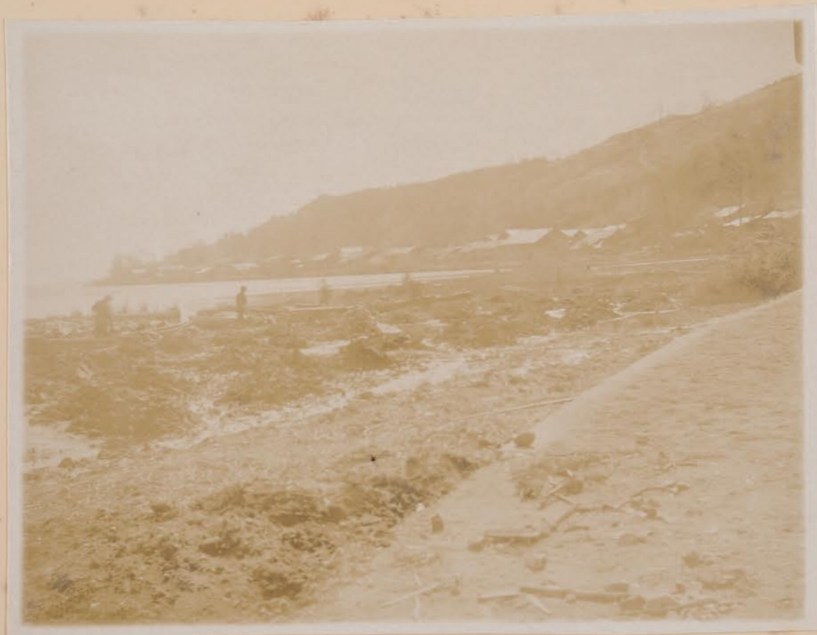
内灘砂丘、内作=母道口原港、166号、地帯肥後土、 上ノ水田依ヲ長後