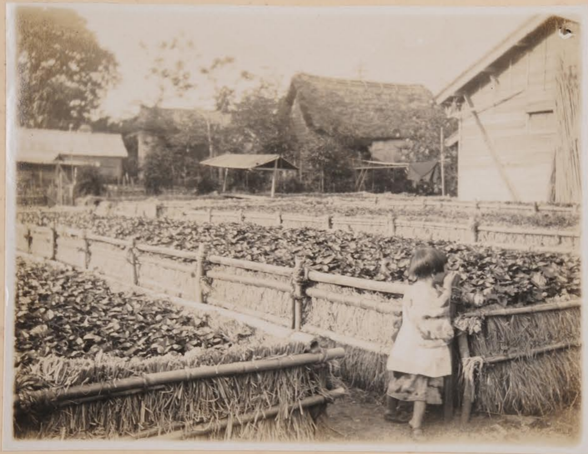
金沢市南郊、サツマニ、苗床