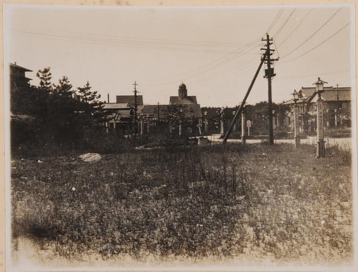
砂丘北帯1-利用地. 27 28 29 30 案44号遊園地