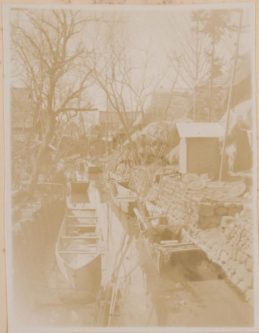
八田村 橋下沿字生坊