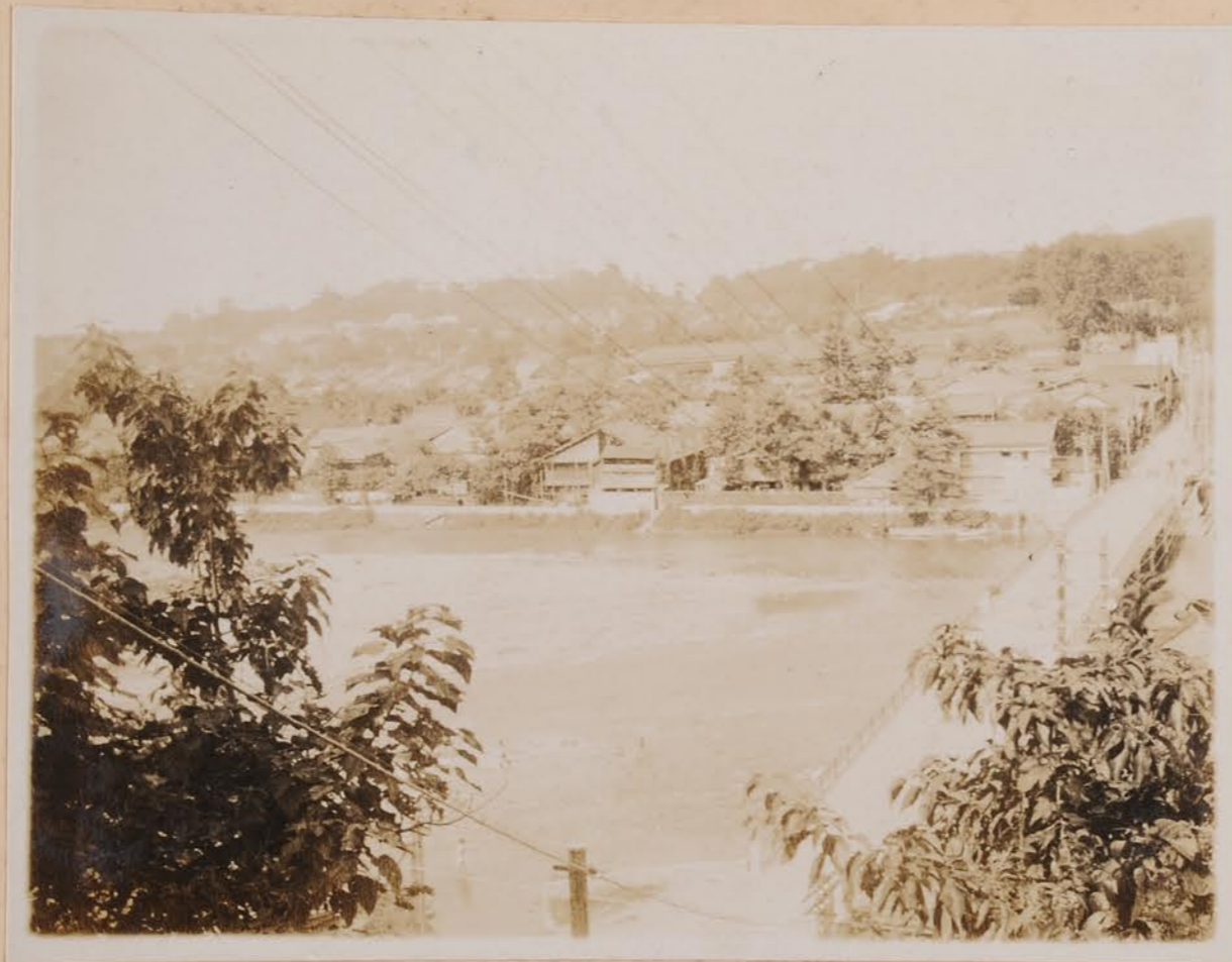
野分台地 W 坂上の風景以小立野元地芝端奇 中央、伯竹右間地 左星、犀川及樺橋