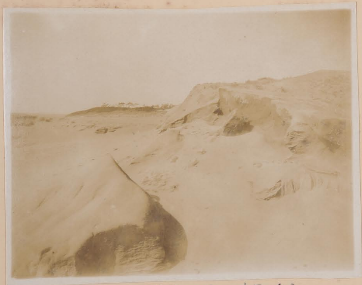
河北阿拉善大漠，梅奇沙丘 遠望白尼