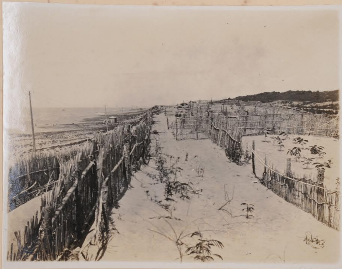
砂丘 / 植物を防止し砂の垣にアカリ / 柵付 気取所也