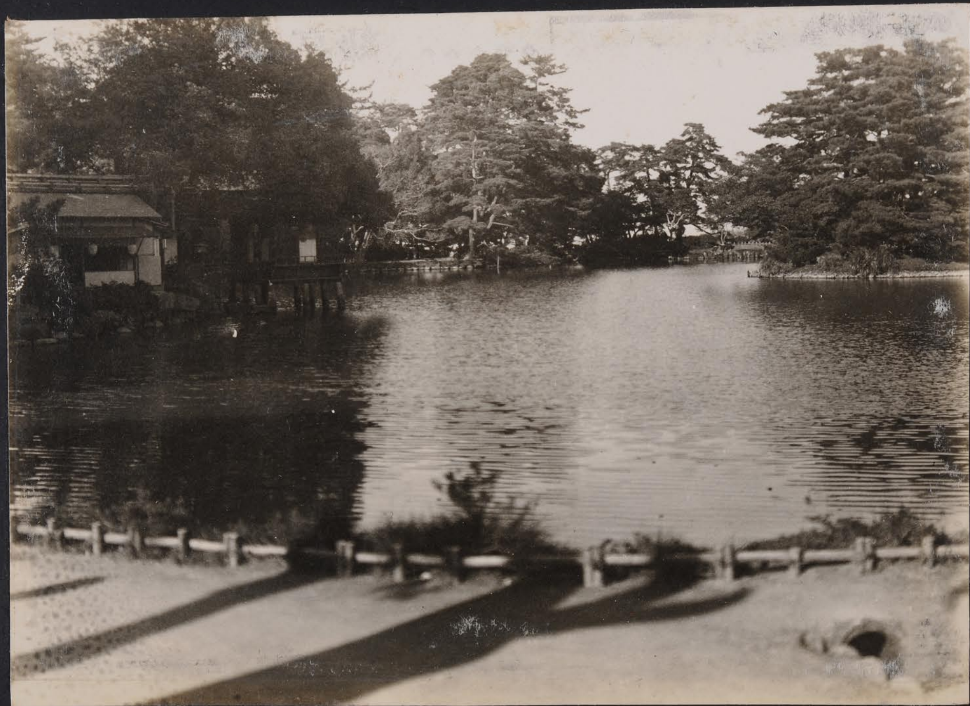
廣齊田前池ヲキ大タラ穿ニ所タイ續ニ台歳子 池カ霞園六兼 ルハ去トエダレヲ造ニ時