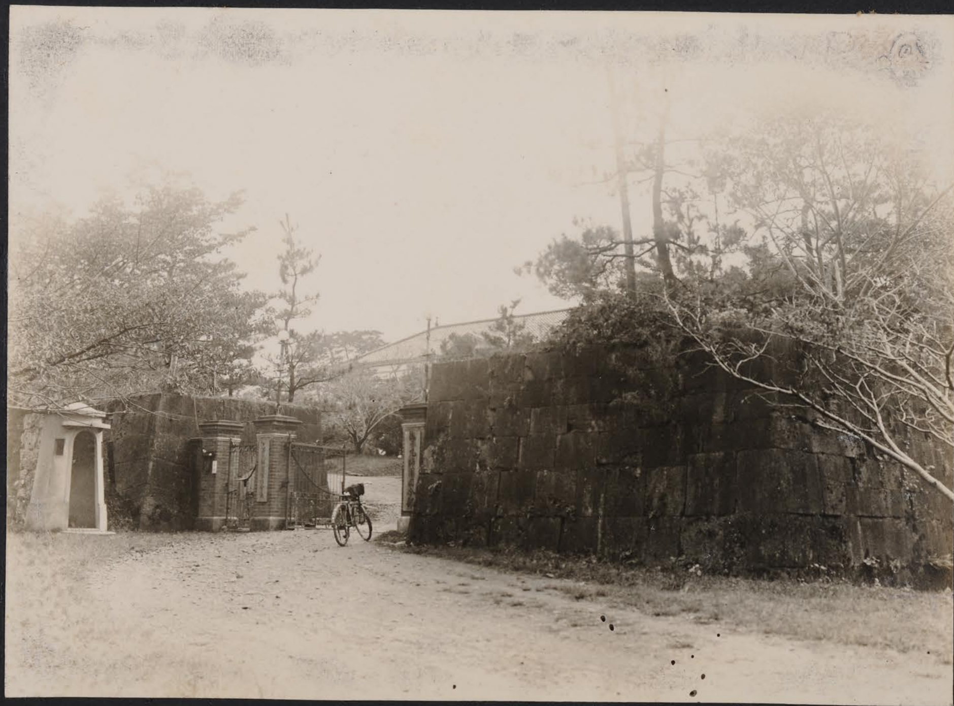
張松大ノ軍陸後彼戰年八七廿治明ハ團師九第 部令司團師九第 三ハテ三ト部令司ヲモダツ至、ルヲセ置設ニ伴ニ ダツ至ニル見ヲ廳開、ソ日八月一十年一十