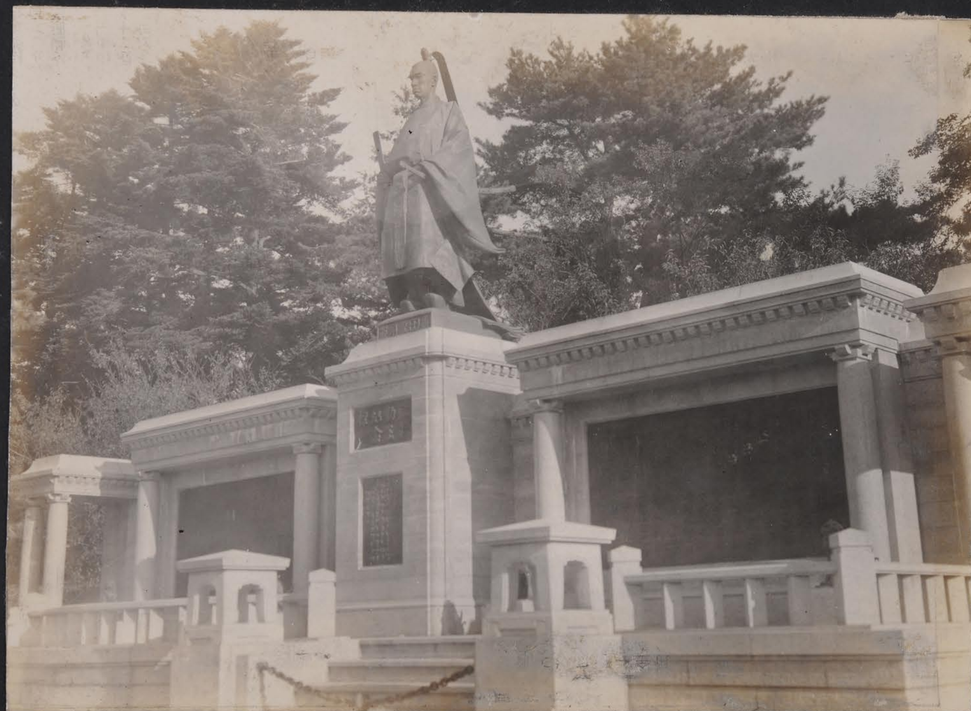
（公寧慶像銅）興士志王勤新維跡郎川谷長園六兼