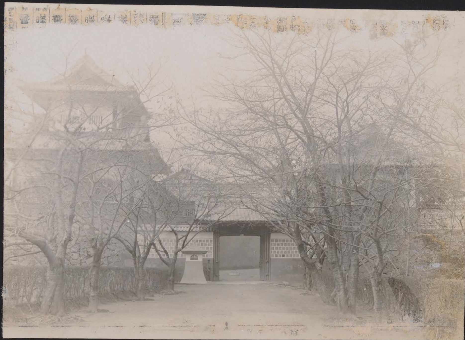
金澤城搦手石川門正面