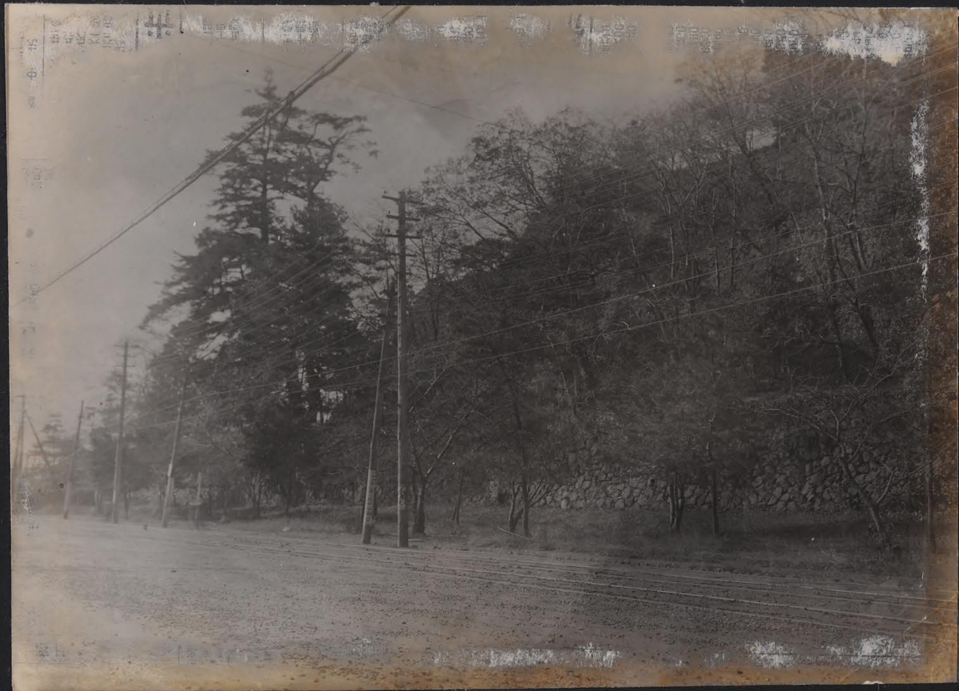
金澤城天主閣址石疊 東側