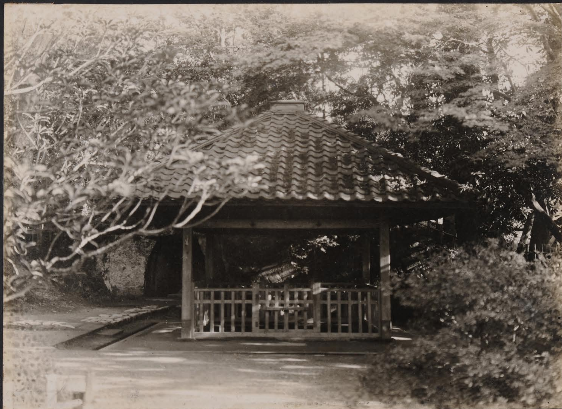
金城靈澤 兼六園西南隅 = 涌泉之碧氷常 = タ、ハ 如何ル大旱 = 毛酒渴スルコトナシト稱セラル