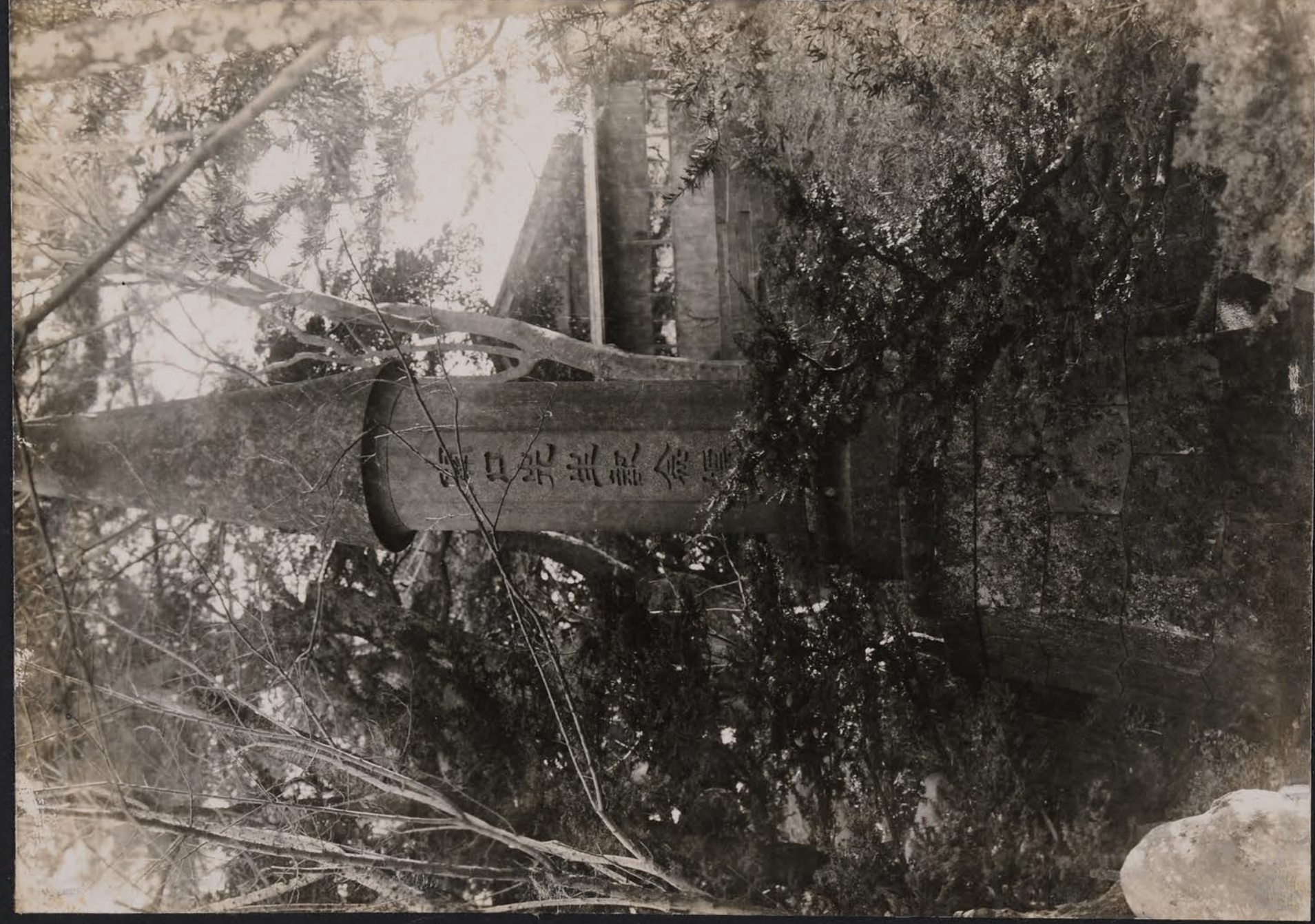
於山尾神社神境明初治明山神境社神 閣先生紀念碑(先生名野田山)