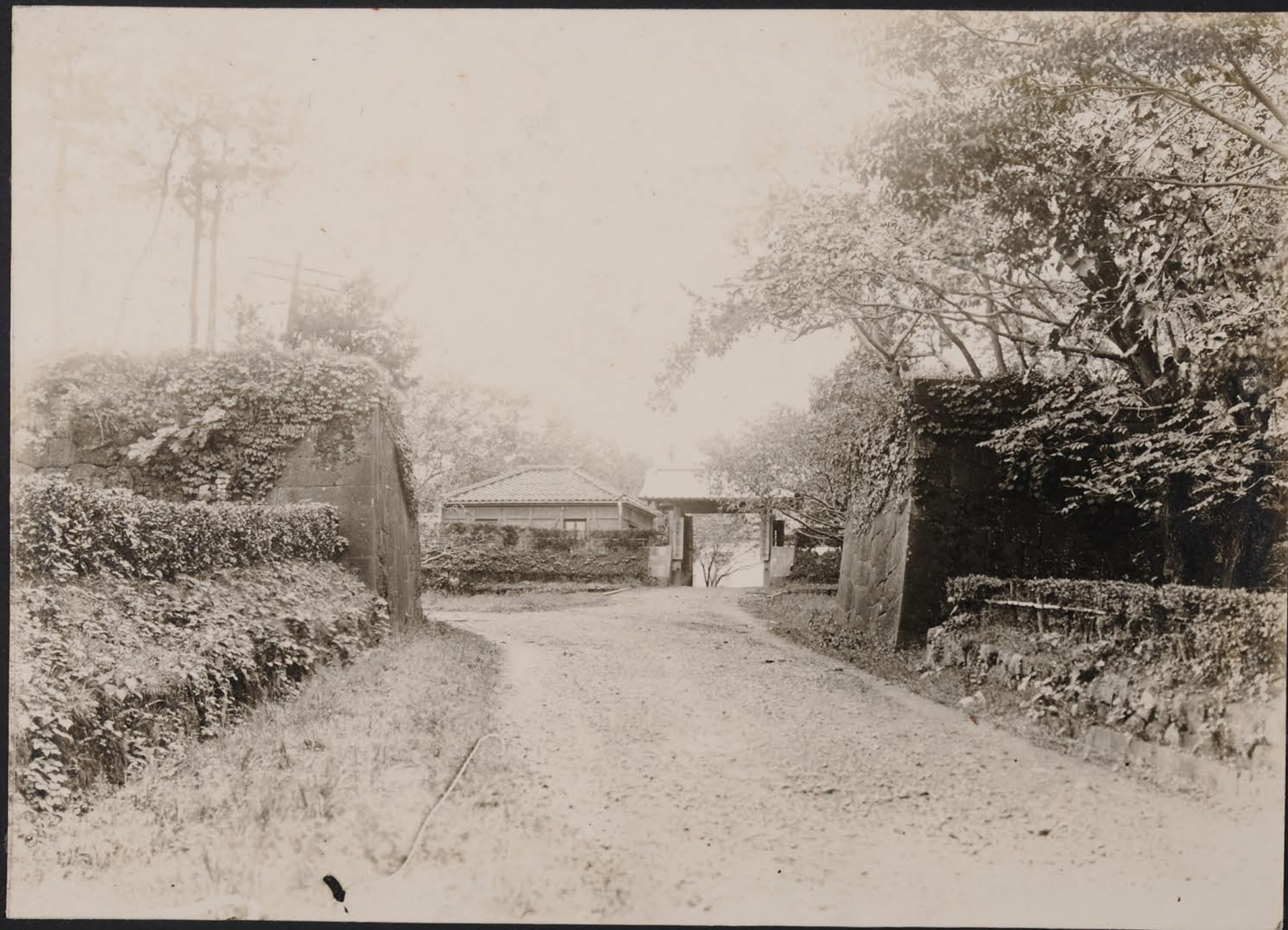
司合部 位置置 全況二 丸藩侯殿閣 ルアテ新タツ在