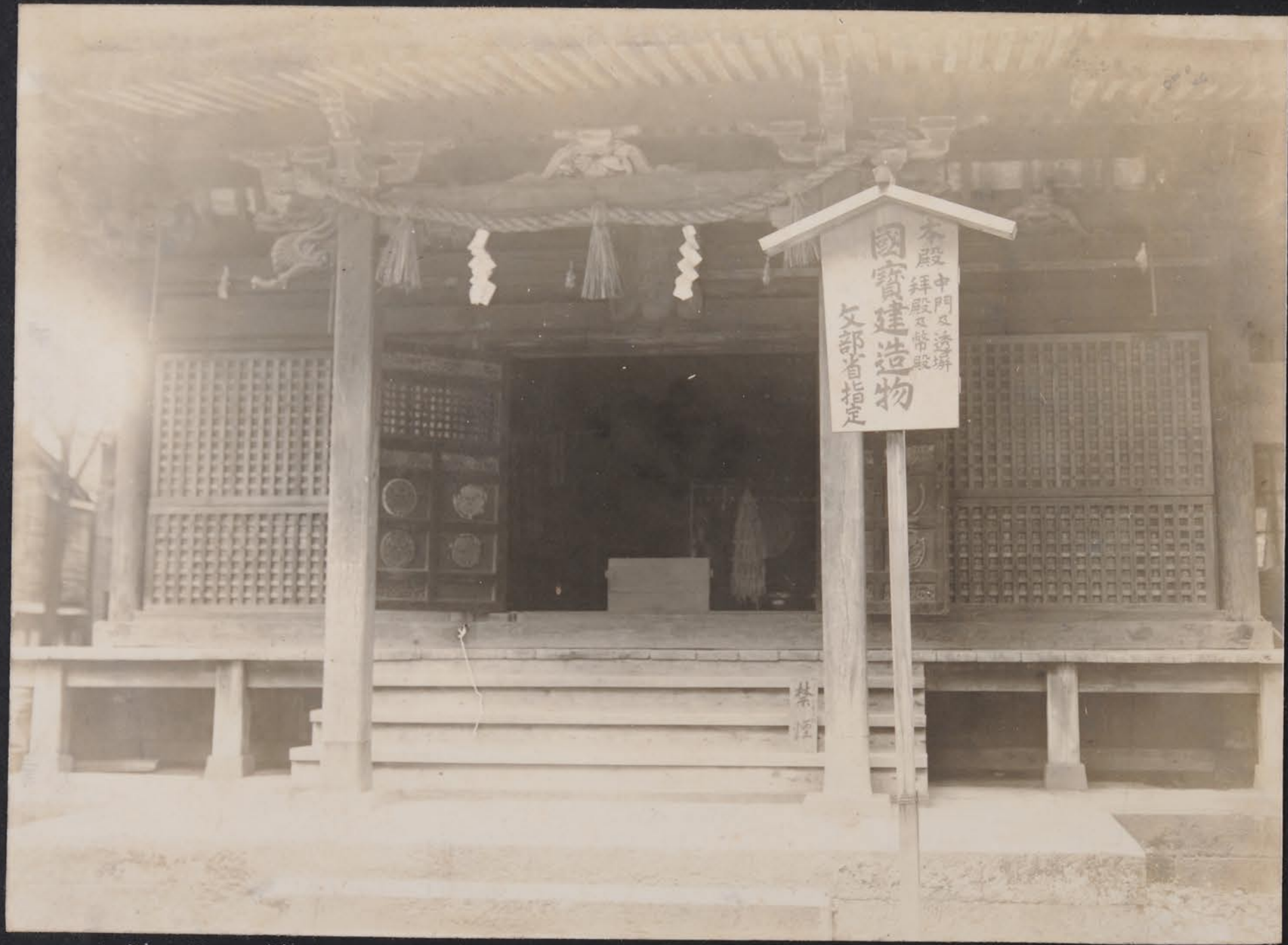
日光東照宮形式ノ種ノ建築ハ 金澤市西尾崎神社 北陸ニハ他ニ見ズ元権現堂ト稱シ 金澤城内ニ在リ今モタツ地ニ遷シ 元ノ形トモテ