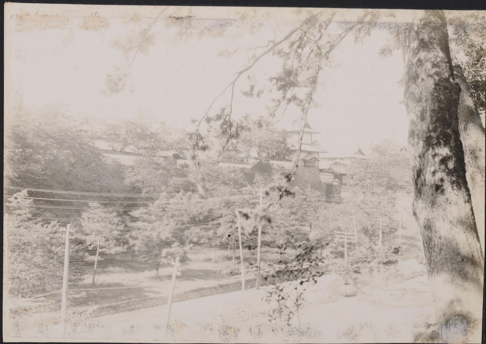
兼、園、百り、堀、越、工、石、川、門、可、山