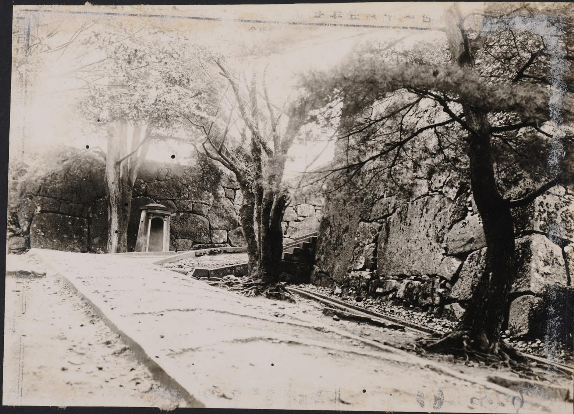
今歩兵七聯隊 正門 金澤大城 尾坂口