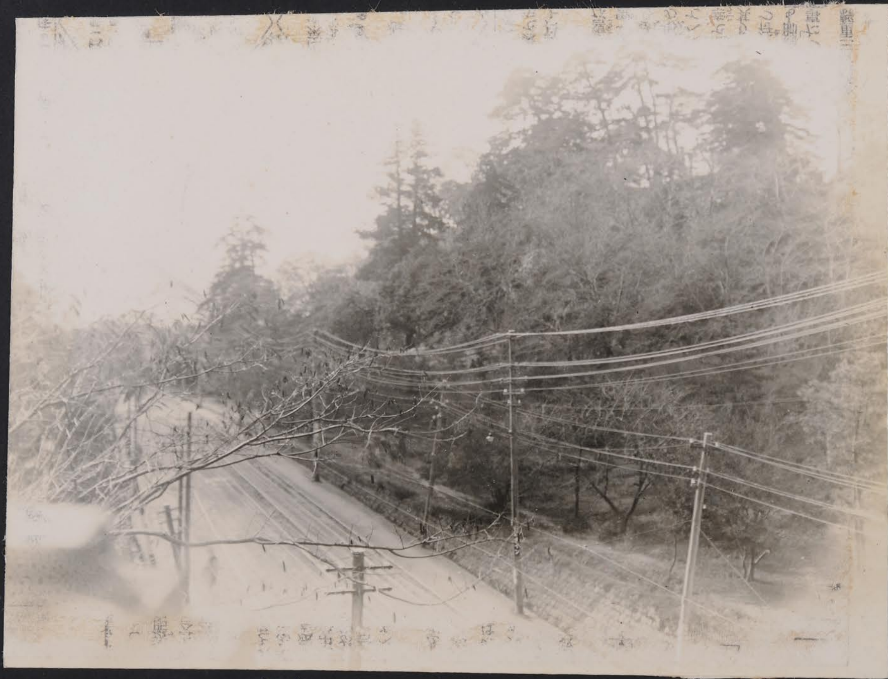
石 門 堀