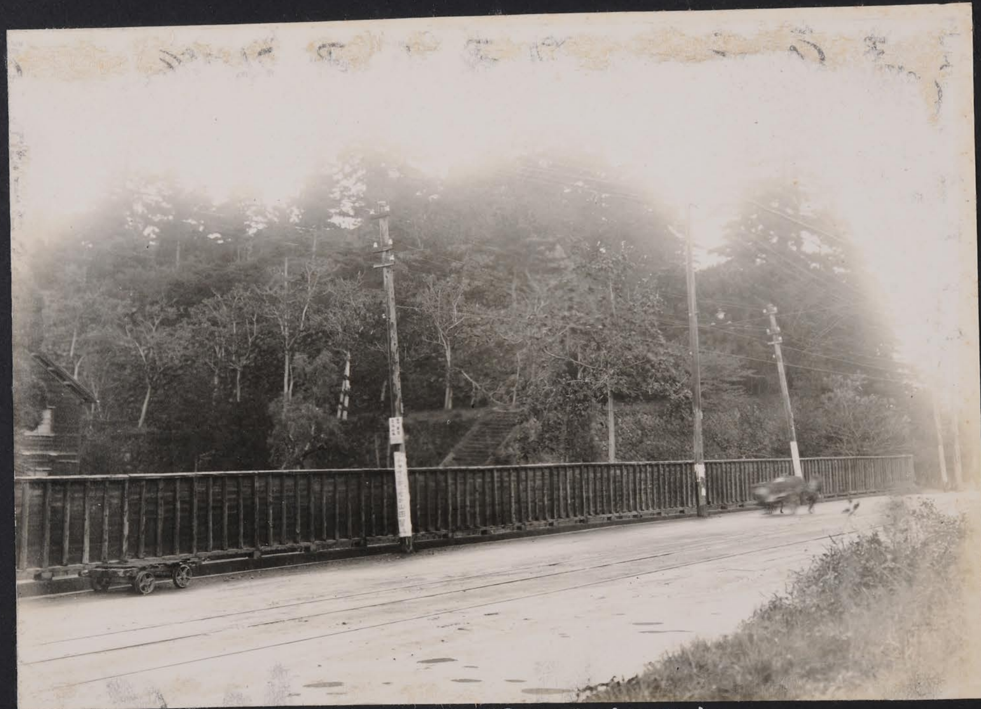
金澤城天主閣址石畳 南側