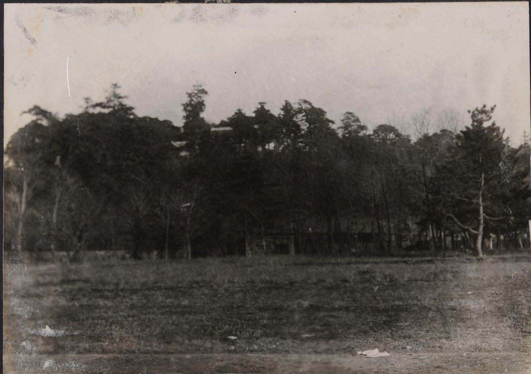
例西跡城澤金ル夕々跡リヨ校學等高四第